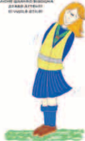
ANCHE QUANDO BISSONA SI ARRATTAH SI VUOL È STAB

vi trovate in montagna o in zone poco frequentate e dovete decidere se fermarvi o continuare: ciò può succedere ad esempio nel caso in cui qualcuno faccia fatica a camminare per problemi fisici (ad es., per una distorsione della caviglia). Sarebbe davvero pericoloso trovarsi da soli, con un infortunato, senza sapere quanto dista un possibile aiuto, o peggio, senza avere la minima idea di dove ci si trova!