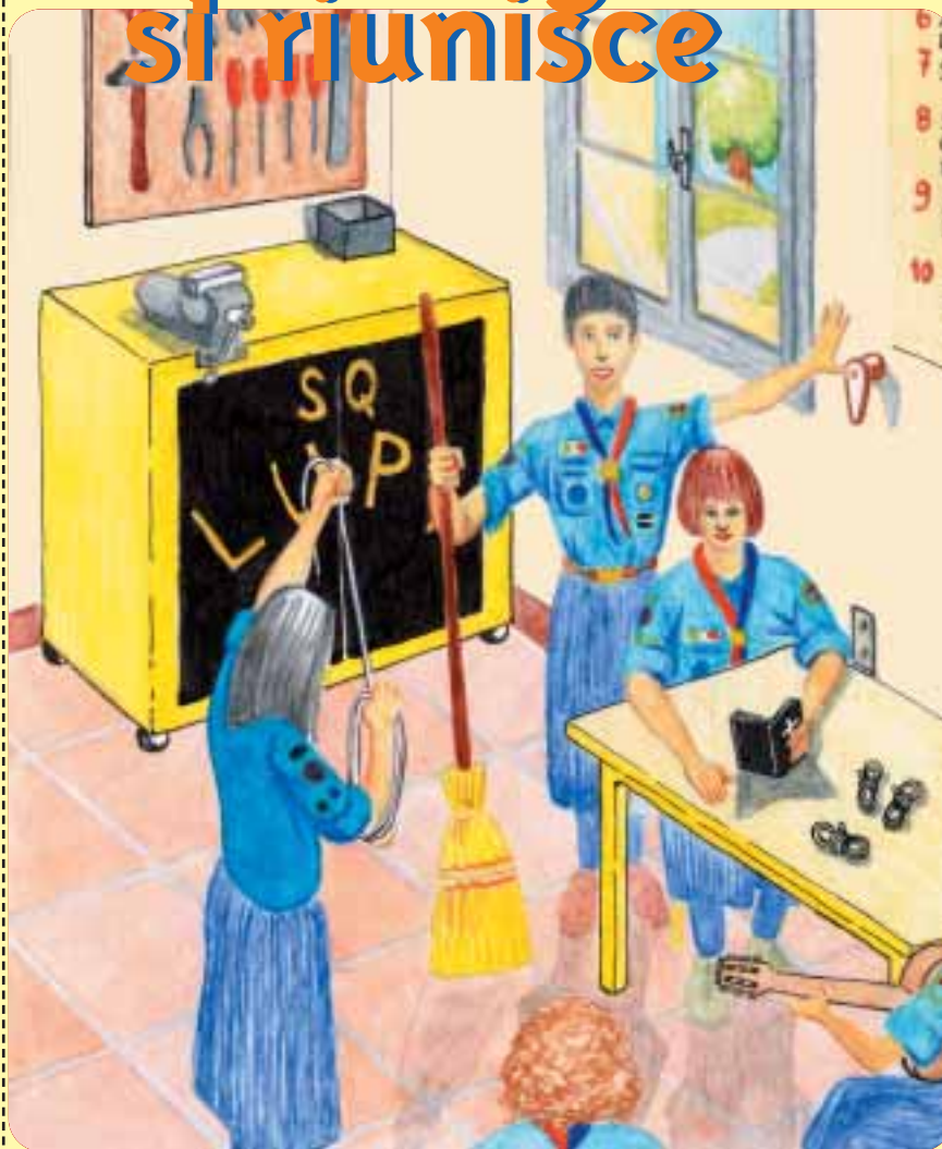
INSERTO di SCOUT AVVENTURA n.7 di OTTOBRE 2004