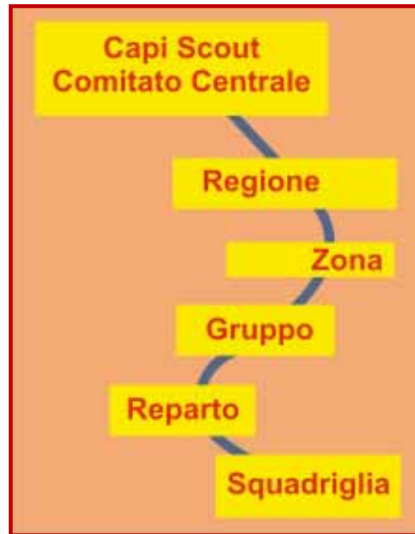
Fig.1 - Organigramma semplificato dell'AGESCI

re ufficialmente l'Agesci e renderla funzionante; Incaricati Regionali per garantire la rappresentanza territoriale, l'istituzione delle Cooperative scout, la prima formazione dei vostri Capi e tanto altro; Incaricati di Zona per coordinare servizi più efficienti a livello locale (momenti formativi per Capi, Caccia di Primavera, S.Giorgio, ecc...); i Capi Gruppo che coordinano i vostri censimenti e molte altre cosette; i Capi Unità , nel vostro caso il Reparto , che hanno ricevuto una formazione specifica per accompagnarvi lungo il vostro sentiero. Solo così potete esserci anche voi, con la vostra Squadriglia in uscita! Organizzati come tutti quelli che vi precedono: con il vostro materiale, con il vostro Capo Squadriglia, con i vostri Incarichi e Posti d'Azione ma, soprattutto con la vostra AUTONOMIA , che non può essere veramente vostra senza ORGANIZZAZIONE!